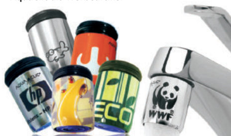
AquaClic farbig und Edelstahl an Hahn mit Innen- und Aussengewinde. Standard- oder individuelle Dessins, max. Werbefläche 20 cm 2